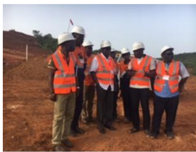
Photo 2 : l'équipe de mission sur la carrière d'exploitation d'or