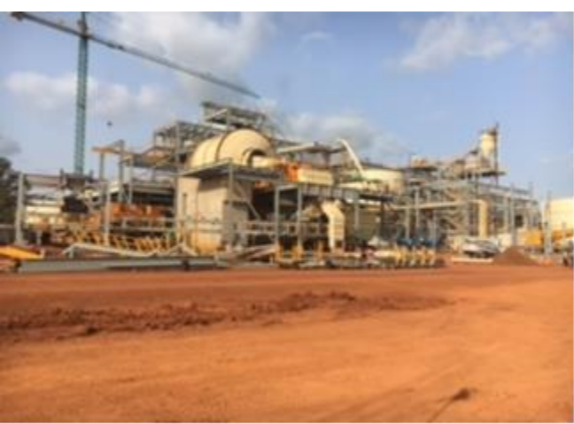
Photo 1: L'usine d'extraction d'or en construction